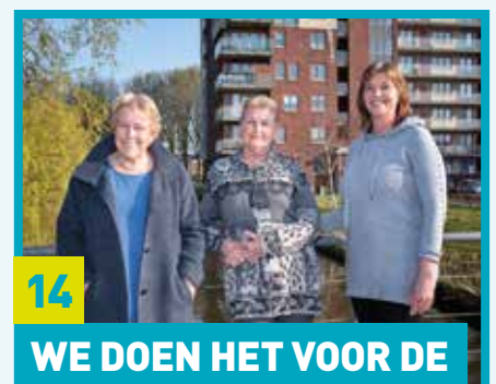
Foto omslag: Nieuwe bewoner Kingsford Smithstraat krijgt de sleutel.